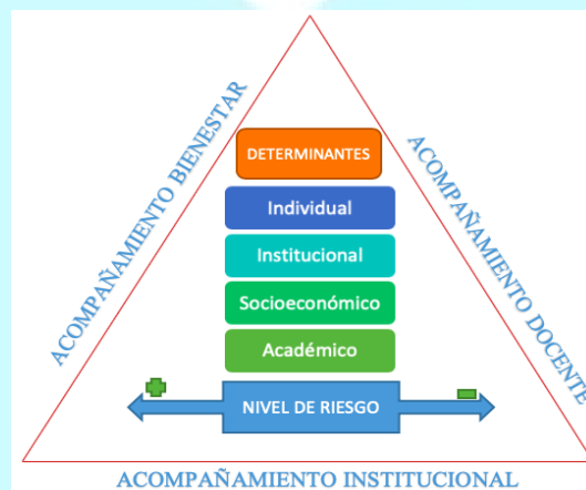
Figura 3. Programa de Retención y Acompañamiento al Estudiante (Modelo Institucional de Bienestar, Unisanitas).

La apuesta por la permanencia y la graduación estudiantil de la Fundación Universitaria Sanitas tiene como pilar el acompañamiento en tres niveles de gestión: a) Institucional, b) Bienestar, y c) Docente, los cuales se materializan en cada determinante a través de cuatro líneas de acción del Modelo, a saber: 1. Universidad Saludable 2. Consejería Individual 3. Desarrollo Lúdico-Deportivo 4. Apoyo Socioeconómico, las cuales impactan directamente en el rendimiento académico estudiantil, y por ende en su permanencia.